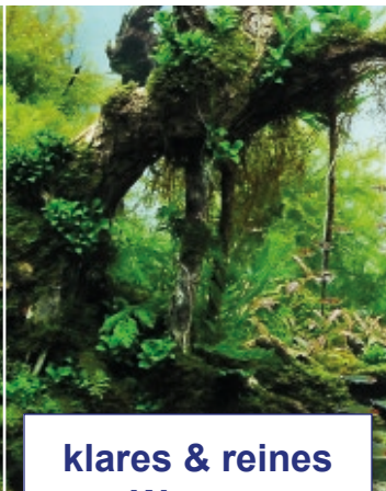
klares & reines Wasser