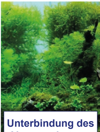
Unterbindung des Algenwachstums

Diese Technologie der sogenannten Wasserelektrolyse wird von uns bereits seit über 15 Jahren erfolgreich in der industriellen Wasser-Desinfektion und -Entkeimung eingesetzt. Nun findet diese Technologie auch ihren Einsatz in der Wasserbehandlung von Aquarien.